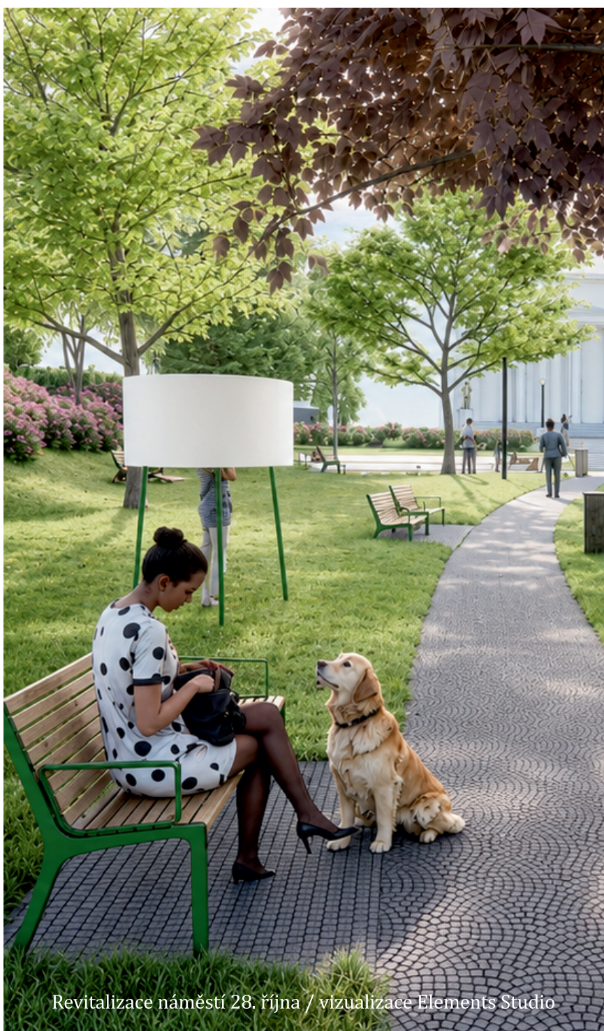
Revitalizace náměstí 28. října / vizualizace Elements Studio