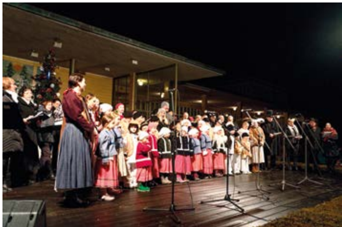
U Společenského domu se 9. prosince zpívaly koledy. A to stejně, jako tou dobou zazněly na řadě míst republiky. Luhačovice se tak poprvé zapojily do akce Česko zpívá koledy.