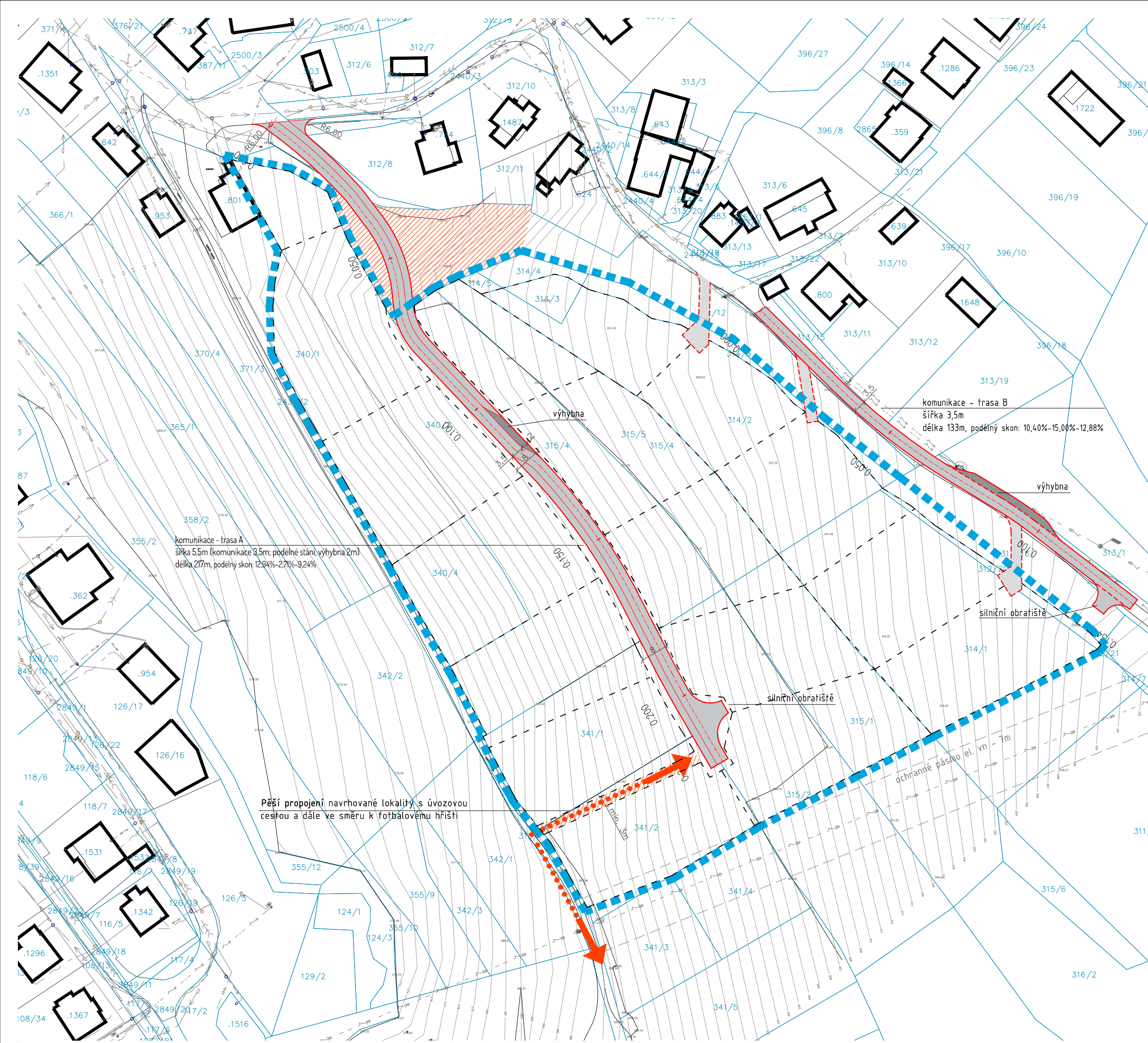
TRASA A - VÝŠKOVÉ POMĚRY