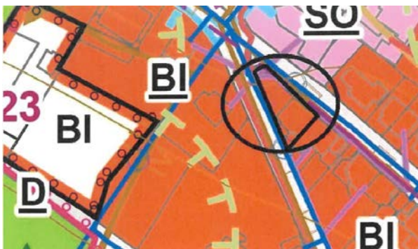
Vyznačení situace požadavku

Navrhovaná změna řeší změnu funkčního využití pozemků parc. č. st. 1651, 450/17 a 450/47, k.ú. Luhačovice, v lokalitě stávající zástavby, která je tvořena stavbou rodinného domu. Dotčené pozemky jsou ve vlastnictví žadatele, který má v současné chvíli investiční záměr realizace (legalizace) penzionu a potřebného parkovacího stání. Z tohoto důvodu žádá o úpravu plochy individuálního bydlení (BI) na plochu smíšenou obytnou (SO), jež uvedený záměr umožní.