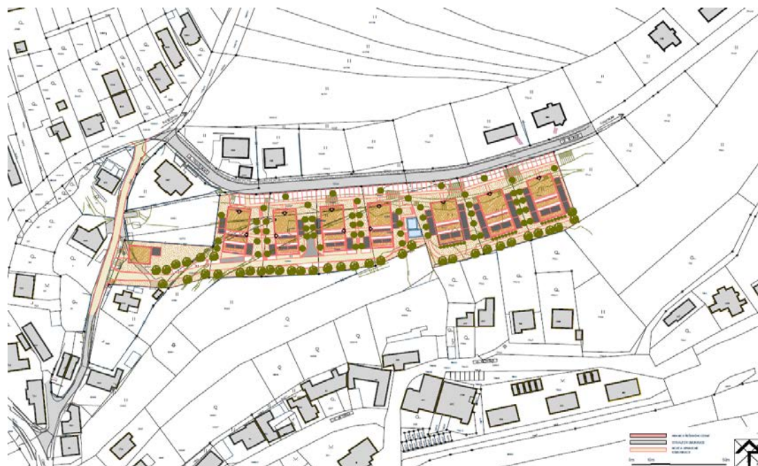
Plošné řešení zástavby sedmi bytových domů v plochách BH č. 282 a 286