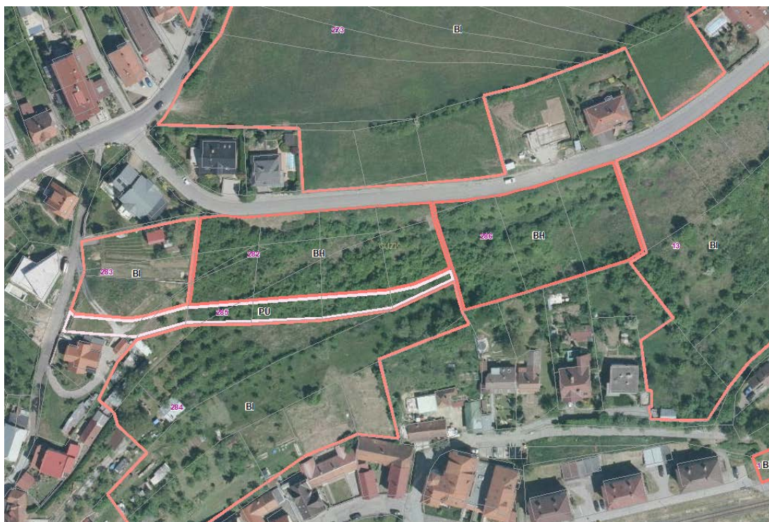
Územní členění ploch s rozdílným způsobem využití – navrhované plochy BH č. 282, 286 a PU č. 285

Pro plochy č. 282 a 286: do všech bytových domů musí být zajištěn přímý vstup ze stávající přílehlé ulice Slunná (v ploše č. 282 budou i vstupy z navrhované komunikace v ploše č. 285), před vstupy z ulice Slunná bude situován pás zeleně, alej stromů, chodník a parkoviště